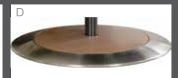
Teller Holz mit Edelmetallring