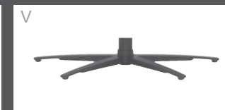
Sternfuß pulverb. Anthrazit