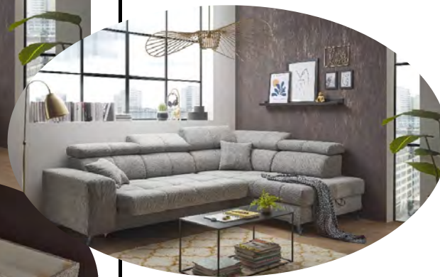
Glow 05 taupe