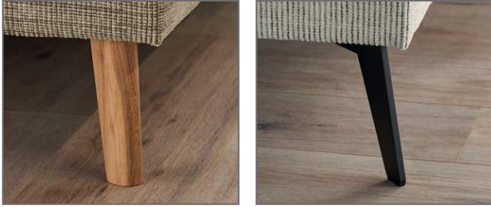
Holzfuß massiv, eichefarbig Metallfuß schwarz lackiert