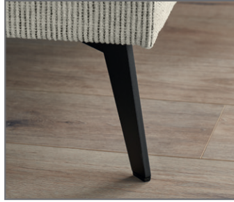
Holzfuß massiv, eichefarbig