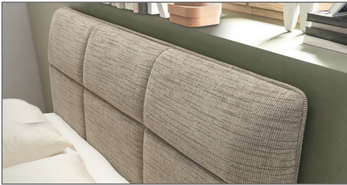
Kopfteil gesteppt mit Keder