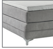
Bezug 1 + 6