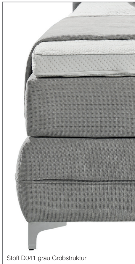
Stoff D041 grau Grobstruktur

Bettkasten glatt mit Eckapplikationen und Kufe.