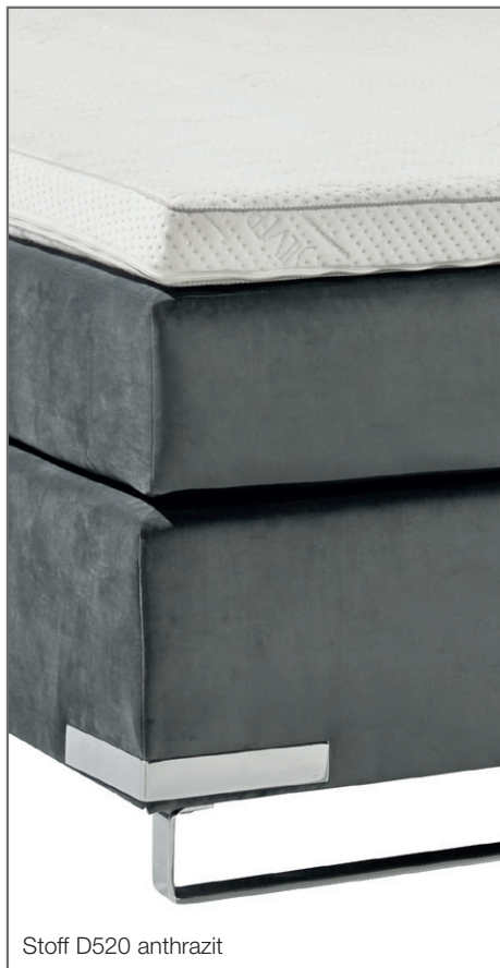
Stoff D520 anthrazit

Bettkasten glatt mit Eckapplikationen und Kufe.