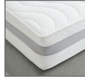
Bezug 3 + 5