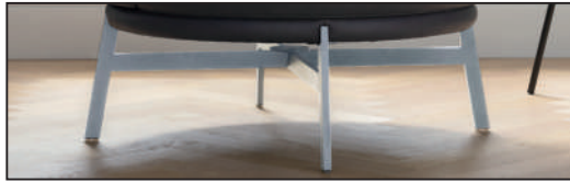
Metallfuß Chrom glänzend (281), 360° drehbar