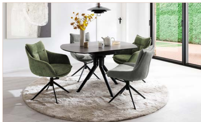
4-Fuß-Stuhl & 4-Fuß-Armlehnstuhl PARKER mit Tisch RUBIKON