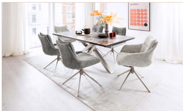
4-Fuß-Stuhl & 4-Fuß-Armlehnstuhl PARKER mit Tisch ALMIROS