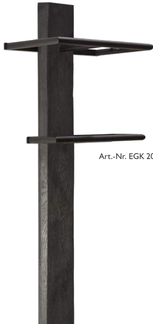
Art.-Nr. EGK 200-KS