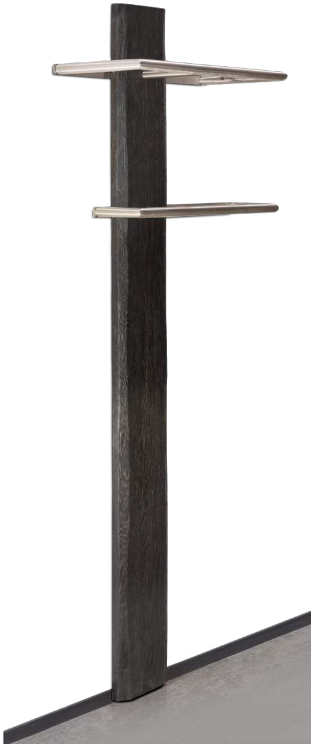
Art.-Nr. EGK 200-K