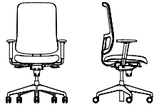
UTILIA SWIVEL CHAIR MESH