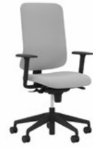
Utila Bürodrehstuhl, gepolsterte Rückenlehne, BLACK