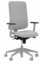
Utila Bürodrehstuhl, gepolsterte Rückenlehne, GREY