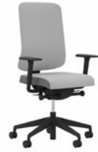
Utila PRO Bürodrehstuhl, gepolsterte Rückenlehne, BLACK