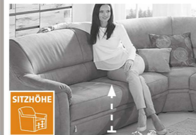
3 Sitzhöhen zur Auswahl

3 Sitzhöhen durch unterschiedlich hohe Möbelgleiter. Nicht möglich bei Funktionselementen. Dadurch ändert sich auch die Rückenhöhe.