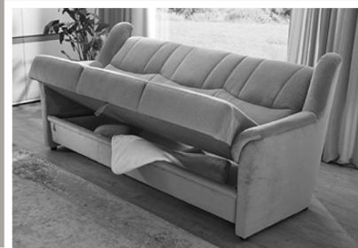
Vorziehfunktion mit Bettkasten