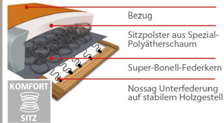
Komfortsitz mit Federkern