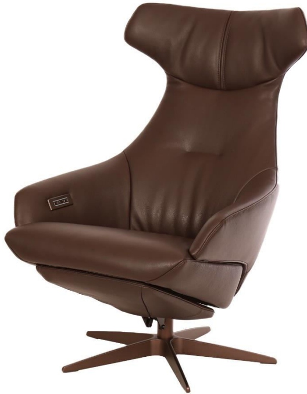
Abgebildet Modell- ARC