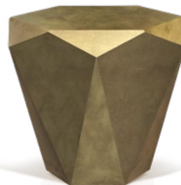
R 145 MA ▶ 103 cm ▼ 103 cm ▲ 40 cm