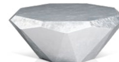
R 145 S ▶ 103 cm ▼ 103 cm ▲ 40 cm