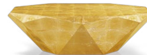
J 145 G ▶ 138 cm ▼ 78 cm ▲ 40 cm