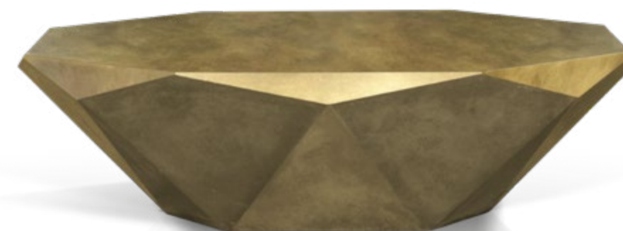
J 145 MA ▶ 138 cm ▼ 78 cm ▲ 40 cm