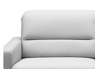
Steppung B (mit Einzug)