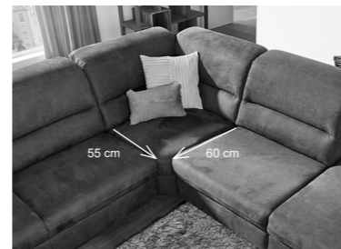
Beide Sitztiefen lassen sich dank Variantenecke in einer Garnitur kombinieren.