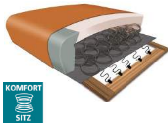
Komfortsitz mit Federkern