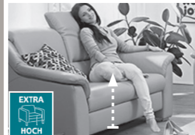
2 Sitzhöhen zur Auswahl