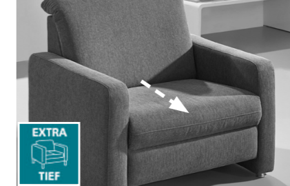
Sitztiefe: 55cm, alternativ: einige Elemente in Übertiefe = Sitztiefe 60cm