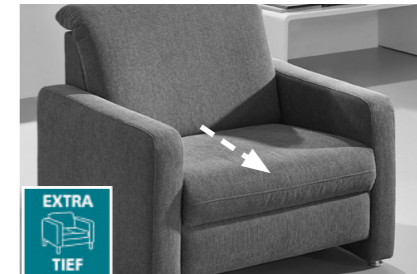
Sitztiefe: 55cm, alternativ: einige Elemente in Übertiefe = Sitztiefe 60cm