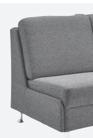
Abschlussblende alternativ zu einem Arm- teil möglich (Mehrpreis)