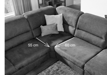
Beide Sitztiefen lassen sich dank Variantenecke in einer Garnitur kombinieren.