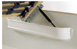
Luxus-Gasdruckfeder zum Öffnen des Lattenrahmens und Nutzung des Stauraums