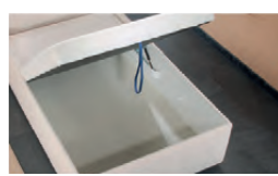
Großraumbettkasten durch aufklappbaren Lattenrahmen