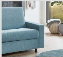
Armlehne A2 B: ca. 18 cm (Stck.)