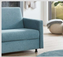
Armlehne A1 B: ca. 10 cm (Stck.)