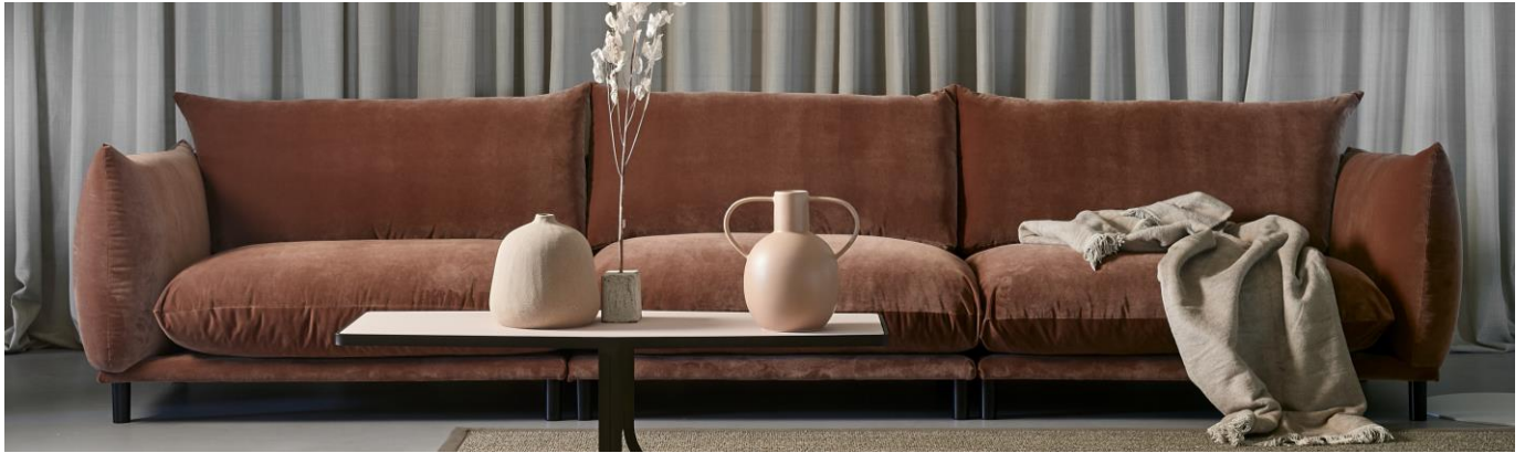
Abbildung: 1,5-Sitz (Armlehne Links) – 1,5-Sitz (ohne Armlehnen) – 1,5-Sitz (Armlehne Rechts).