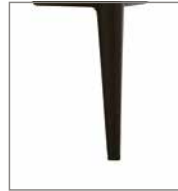
Metallfuß verschie- dene Metallfarben