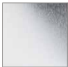
Chrom glän- zend