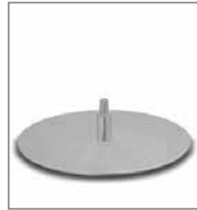
Drehteller Chrom matt Optik