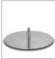
Drehteller Chrom glänzend