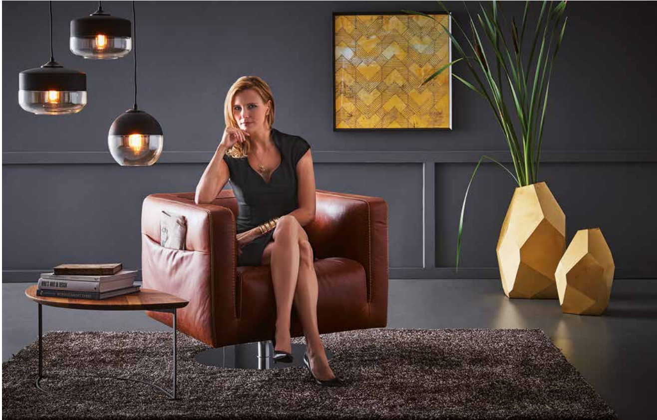
Bezug: Z83/50 cognac