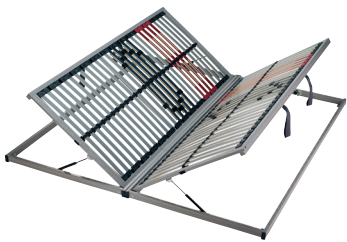
Abb. Classic 28 Side Lift rechts und Classic 28 Side Lift links Rechts oder links über die gesamte Länge hochklappbar mittels Gasdruckfeder.