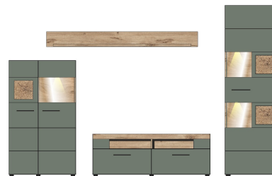
10 A1 H9 81