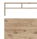
Art.-Nr. 20 A1 H9 02 Beschreibung Couchtisch Breite / Höhe / Tiefe (cm) ca. 110 / 40 / 65