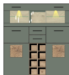
Art.-Nr. 10 A1 H9 22 Beschreibung Barschrank 1 Glas-/Holzklappe 2 Holztüren / 2 Schubkästen Flaschenregal mit 8 Fächern inkl. LED-Beleuchtung Breite / Höhe / Tiefe (cm) ca. 120 / 129 / 37