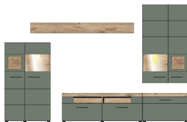
10 A1 H9 80