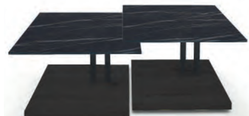
K 925 Art.-Nr. 10 27 797 Tischplatte: Keramik Noir Desire Säule: Edelstahl Schwarz lackiert Sockel: Wildeiche Anthrazit