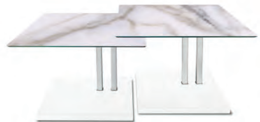
K 925 Art.-Nr. 26 37 023 Tischplatte: Keramik Calacatta Säule: Edelstahl geschliffen Sockel: MDF weiß lackiert