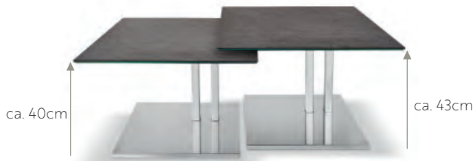
K 525 Art.-Nr. 26 25 017 Tischplatte: Zement Anthrazit Säule: Edelstahl geschliffen Sockel: Edelstahl geschliffen