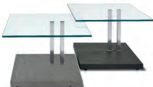
K 925 Art.-Nr. 26 46 013 Tischplatte: Floatglas Säule: Edelstahl geschliffen Sockel: MDF Betonoptik Light/Dark