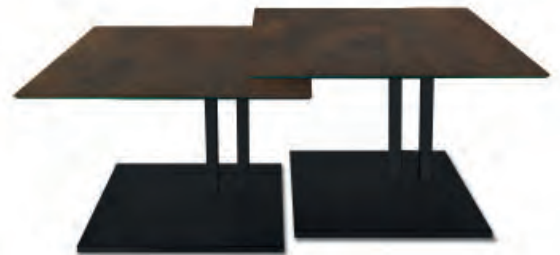
K 525 Art.-Nr. 26 25 017 Tischplatte: Keramik Ossido Bruno Säule: Edelstahl Schwarz lackiert Sockel: Edelstahl Schwarz lackiert