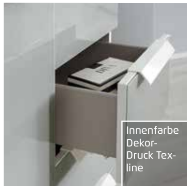
Innenfarbe Dekor- Druck Tex- line