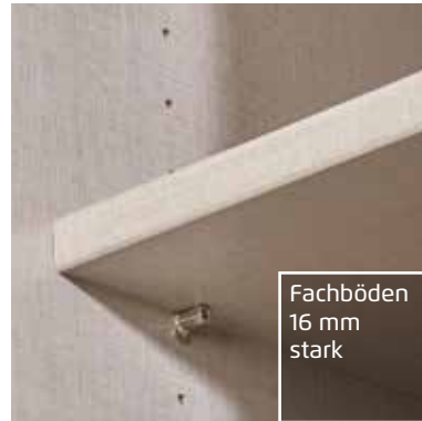
Fachböden 16 mm stark