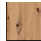
Dekor-Druck Eiche Artisan