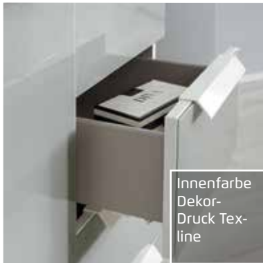
Innenfarbe Dekor- Druck Tex- line