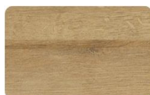
Eichenstruktur Natur Nb.