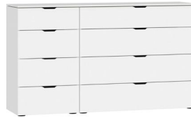
Kommode Typ 12