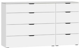
Kommode Typ 13