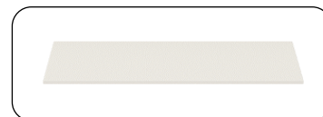
Einlegeböden Breite 45 und 90 cm