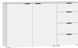
Kommode Typ 18