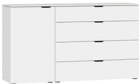
Kommode Typ 15