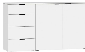
Kommode Typ 16