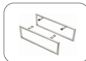
Möbelkufen Schwarz matt und edelstahlfarbig