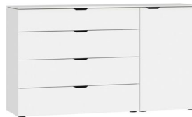
Kommode Typ 14