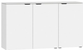
Kommode Typ 19