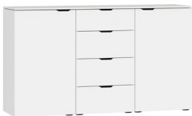
Kommode Typ 17