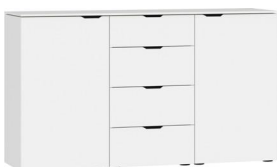
Kommode Typ 17