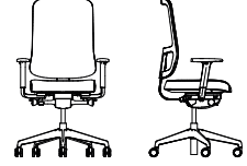
UTILIA SWIVEL CHAIR MESH PRO