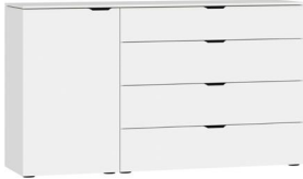
Kommode Typ 15