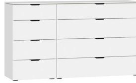
Kommode Typ 12