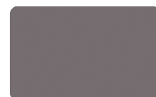
Glas Dunkelgrau mat