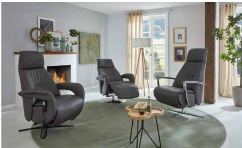
Seitenteil A (Polster offen) Seitenteil B (Metall)