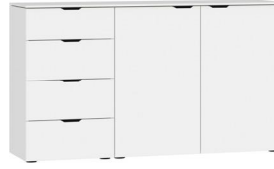
Kommode Typ 16