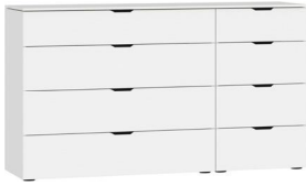
Kommode Typ 13