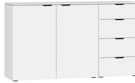
Kommode Typ 18