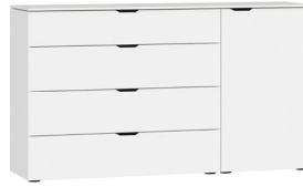
Kommode Typ 14