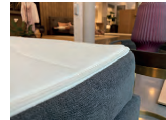
Stoff- und Drellbezogen kombiniert