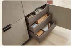
Innenschubkästen schaffen Platz.