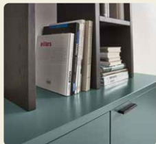
Das Hängesideboard ist mit einem Aufsatzregal kombiniert.