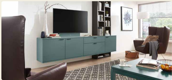
Wohnkombination 40138, B/H/T ca. 270,0/215,7/49,2 cm Couchtisch 90302, B/H/T ca. 120/40,8/75 cm Ausführungen: Lack Ocean, Eiche Graphit