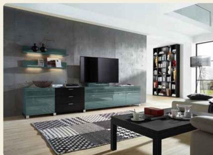
Wohnkombination 40127, B/H/T ca. 330,0/65,0/49,2 cm Regalkombination 31366, B/H/T ca. 148,3/260,9/26,4 cm Couchtisch 90302, B/H/T ca. 120/40,8/75 cm Ausführungen: Lack Ocean Hochglanz, Lack Schwarz

Die beiden kompakten Wohnkombinationen bieten einen modernen Rahmen für die Nutzung aktueller Unterhaltungstechnik. Die TV-Geräte sind über eine Halterung mit dem Möbel verbunden. Die Kombination oben rechts verfügt darüber hinaus noch über die Möglichkeit, Soundtechnik ins Möbel zu integrieren.