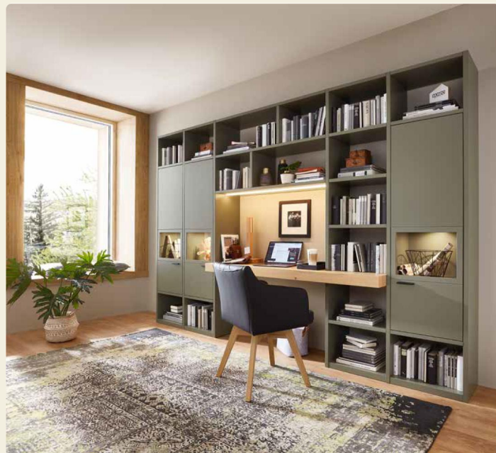
Regalkombination 40745, B/H/T ca. 320,3/215,7/492 cm