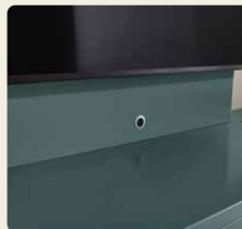
Dank des Funkrepeaters könnt Ihr mit der Fernbedienung z. B. den TV-Receiver im Schrankinneren verstauen, das Signal wird in das Möbellinnere weitergeleitet.