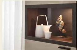
Der Vitrinenrahmen ist in Eiche graphit abgesetzt.

Highboard 40061, B/H/T ca. 180/117,8/39,6 cm Säulentisch 90974, B/H/T ca. 180/77/95,0 cm Vitrine 40135, B/H/T 120/218,3/39,6 cm Stuhl R3 937/44, B/H/T ca. 56/82,5/59,0 cm, SH: 49,3 cm, ST: 43,5 cm Ausführungen: Eiche Graphit, Lack Flatingrau Hochglanz