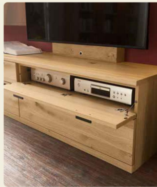
Das Entertainment Equipment verschwindet hinter der Technikklappe

Regalkombination 40704, B/H/T ca. 184,1/280,9/36,0 cm Couchtisch 91031 mit Tischplatte (Klarglas), B/H/T ca. 120/46,1/78 cm Wohnkombination 40603, B/H/T ca. 360,0/218,3/49,2 cm Ausführungen: Asteiche, Lack: Grau