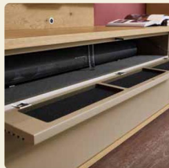
Hinter der praktischen Klappe verschwinden die Geräte.

Ein modernes und leichtes Wohnbild ergibt sich aus den solitär stehenden Einzelementen der Wohnkombination in Lack Cashmere und Asteiche. Der symmetrische Aufbau der Elemente schafft Ruhe und fügt sich harmonisch ins Ambiente ein.