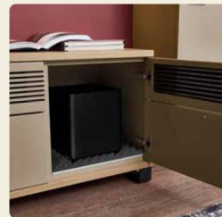
Auch der Subwoofer ist mangoptimiert untergebracht.