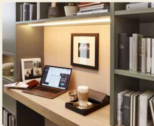
Eine gute Ausleuchtung ist wichtig und schont die Augen.