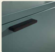
Griffe wahlweise Chrom glänzend, edelstahlfarbig oder wie hier, in Lack Schwarz matt.