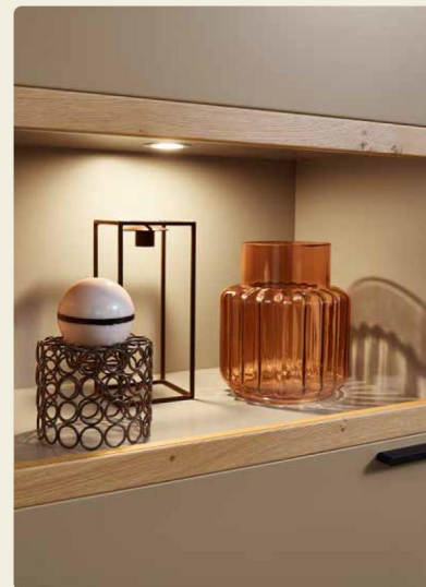
Die Vitrinen sind angenehm beleuchtet.

Wohnkombination 40744, B/H/T ca. 360/188,2/49,2 cm Couchtisch 9030, B/H/T 120,0/41,1/75 cm Sideboard mit Kufen 40041, B/H/T ca. 240/100,2/39,6 cm Wandbord 90551, B/H/T ca. 180/17/20 cm Ausführungen: Asteiche: Lack Cashmere