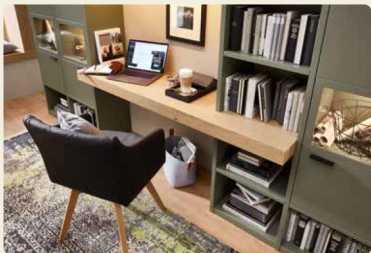
Die integrierte Schreibplatte kann für die private Korrespondenz gut genutzt werden.

Von diesem Platz aus schaut man doch gerne nach draußen und genießt das Leben. MONDO Artist bietet euch jede planerische Freiheit, euer Möbel ganz an eure Räumlichkeiten und eure persönlichen Bedürfnisse anzupassen. Wie hier zum Beispiel eine schöne Kombination aus Bücherregal, Vitrinen und einem kompakten Arbeitsplatz für das Heimbüro in Lack Olivgrau und Asteiche furniert. Alles kann – nichts muss.