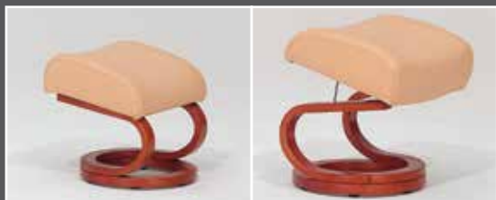
Beispieldarstellung: höhenverstellbarer Hocker

Sitzen, lesen, entspannen - die variable Kopfstütze läßt sich individuell auf Ihre Wunschposition einstellen