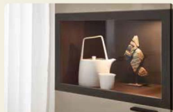
Der Vitrinenrahmen ist in Eiche graphit abgesetzt.

Highboard 40061, B/H/T ca. 180/117,8/39,6 cm Säulentisch 90974, B/H/T ca. 180/77/95,0 cm Vitrine 40135, B/H/T 120/218,3/39,6 cm Stuhl R3 937/44, B/H/T ca. 56/82,5/59,0 cm, SH: 49,3 cm, ST: 43,5 cm Ausführungen: Eiche Graphit, Lack Flamingrau Hochglanz