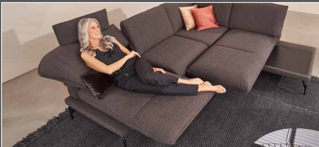
Variante 37 2,5-Sitzer mit Drehsitz links Rücken mit Gasdruckfeder links