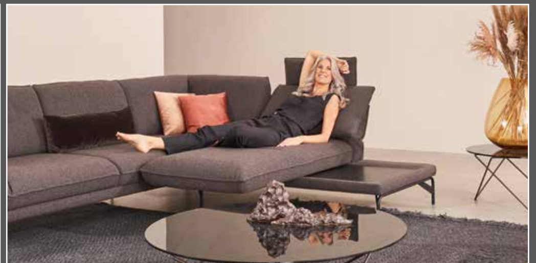
Variante 56 mit integrierter Ecke Drehsitz im offenem Abschluss Rücken mit Gasdruckfeder im Drehsitz