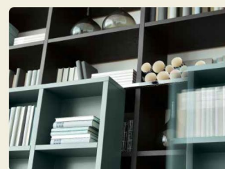
Die Schieberegalen werden oben und unten leichtgängig geführt.