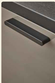
Griffe wahlweise Chrom glänzend, edelstahlfarbig oder wie hier, in Lack Schwarz matt.

Wer neben einer Wohnkombination auch eine Bibliothekslösung mit zwei esstf. laufenden Schieberegalen zu schätzen weiß, findet hier die Erfüllung seiner Träume. Die Schiebeelemente geben je nach Situation und Anforderung unterschiedliche Bereiche Ihrer Bibliothek frei, z. B. Buchrücken oder Accessoires, Magazine oder Bildbände.