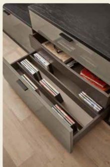
Mit Innenschubkästen schafft ihr Ordnung.