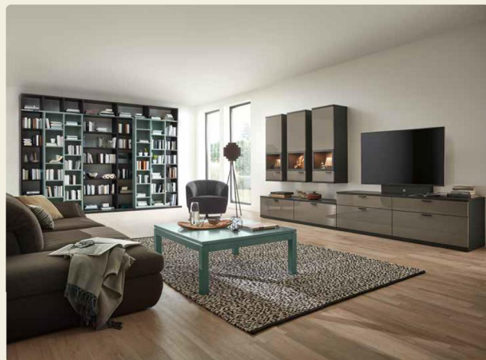
Regalkombination freie Planung, B/H/T ca. 3578/2509/55,2 cm