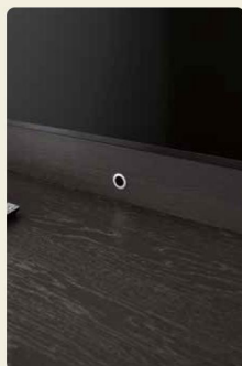
Dank des Funkrepeaters könnt ihr mit der Fernbedienung z. B. den TV-Receiver im Schrankinneren verstauen, das Signal wird in das Möbelinnere weitergeleitet.