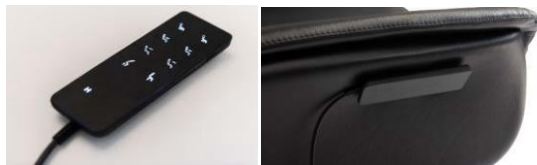
Kabelgebundene Fernbedienung Sessel 4-Motoren + Massage.