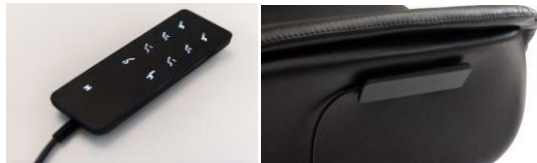
Kabelgebundene Fernbedienung Sessel 4-Motoren + Massage.