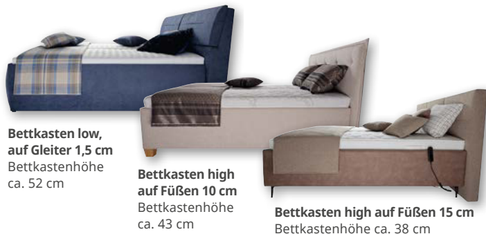
Bettkasten low, auf Gleiter 1,5 cm Bettkastenhöhe ca. 52 cm