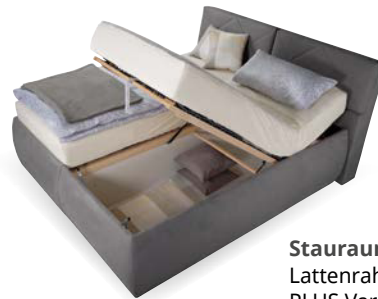
Stauraum durch aufklappbaren Lattenrahmen bei allen vito MELODY PLUS Varianten.

Durch die Einlegevariante der Lattenrahmen Nutzung geeigneter Kunden- oder Fremdrahmen möglich.