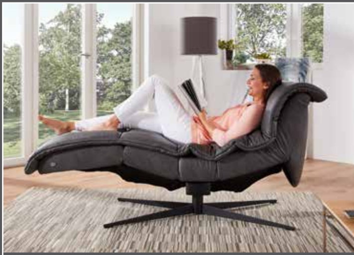
elektrische Verstellung bis zur entspannten Sitzposition