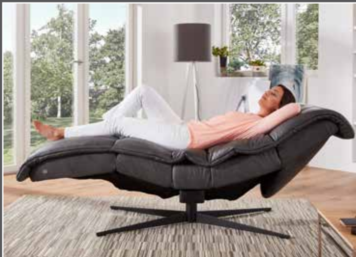
Verstellung des Fußteils, der Sitzneigung und des Kopfteils bis zur waagerechten Schlafposition