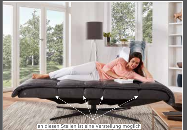
an diesen Stellen ist eine Verstellung möglich