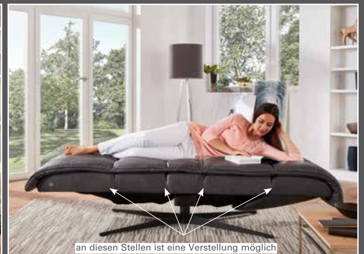
an diesen Stellen ist eine Verstellung möglich mit 4 Motoren läßt sich jede gewünschte Position mühelos einstellen