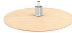
DBU Diskfuß Buche unbehandelt

(Gaslift-Höhenverstellungs-Option nicht möglich)