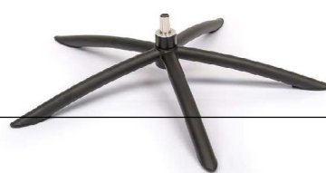
TSS2 Tube Space Metall Schwarz

(Gaslift-Höhenverstellungs-Option nicht möglich)