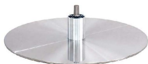
DBB Diskfuß - Metall gebürstet

(Gaslift-Höhenverstellungs-Option nicht möglich)