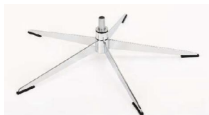
OS Orion Base - Chrom