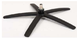
SBS Sirius Base - Schwarz