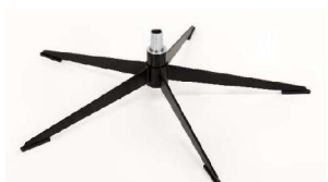
OSS Orion-Base - Schwarz matt

Für alle Fußvarianten Orion Gaslift-Höhenverstellungs-Option möglich