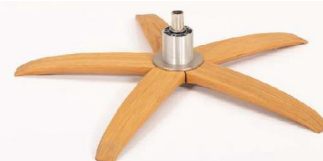
WSK Holzstern Fuß Schwarz