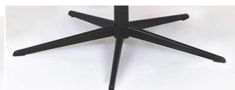
PBS Polaris-Base - Schwarz

Für alle Fußvarianten Polaris (Größen M,L) Gaslift-Höhenverstellungs-Option möglich