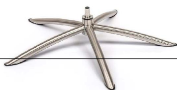
TS Tube Space Metall gebürstet

(Gaslift-Höhenverstellungs-Option nicht möglich)