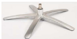
SB Sirius Base - Silver

Für alle Fußvarianten EB/EBS und SB/SBS Gaslift-Höhenverstellungs-Option möglich.