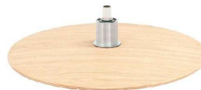
DBS Diskfuß Schwarz

(Gaslift-Höhenverstellungs-Option nicht möglich)