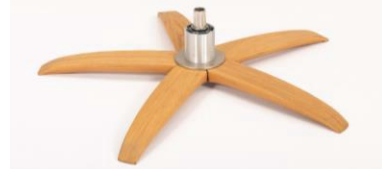
WSK Holzstern Fuß Schwarz