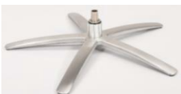
SB Sirius Base - Silver

Für alle Fußvarianten EB/EBS und SB/SBS Gaslift-Höhenverstellungs- Option möglich.