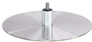
DBB Diskfuß - Metall gebürstet

(Gaslift-Höhenverstellungs-Option nicht möglich)