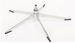
OS Orion Base - Chrom