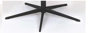
PBS Polaris-Base - Schwarz

(Gaslift-Höhenverstellungs-Option nicht möglich)