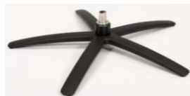
SBS Sirius Base - Schwarz