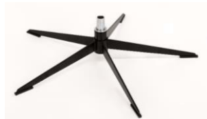
OSS Orion-Base - Schwarz matt

Für alle Fußvarianten Orion Gaslift-Höhenverstellungs-Option möglich