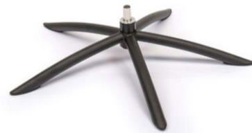
TSS2 Tube Space Metall Schwarz

(Gaslift-Höhenverstellungs-Option nicht möglich)