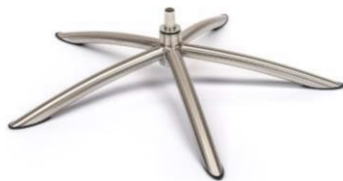
TS Tube Space Metall gebürstet

(Gaslift-Höhenverstellungs-Option nicht möglich)