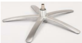
SB Sirius Base - Silver

Für alle Fußvarianten EB/EBS und SB/SBS Gaslift-Höhenverstellungs- Option möglich.