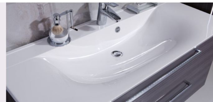
Die Waschtischunterschränke, mit ihren integrierten Einteilungselementen im oberen Schubkasten, bieten praktikablen Stauraum und sorgen für Ordnung im Bad.