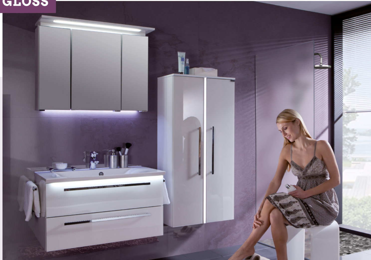
Einzelkombination 906 mm breit, Front- / Korpusdekor: Polarweiß hgl. / Weiß hgl.