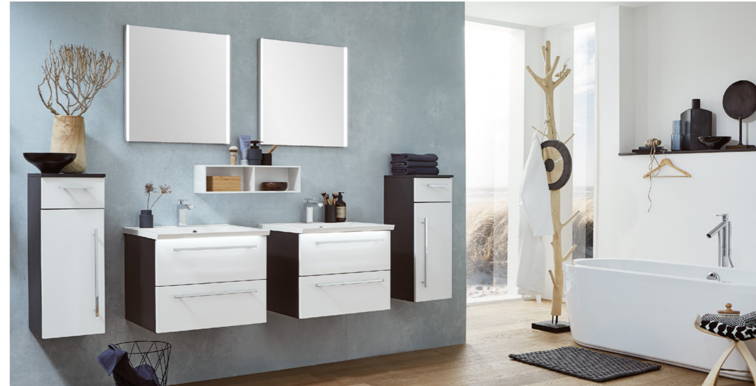
2 x Einzelkombination 606 mm breit, Front- / Korpusdekor: Edelweiß matt / Cosmos grey matt