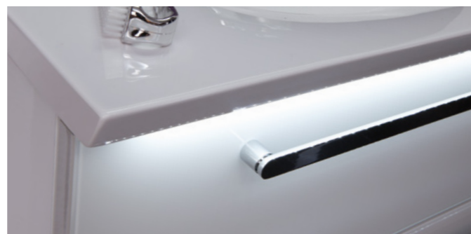
Puristische Formen in drei Breiten bestimmen hier das Design der Mineralguss- und Keramik-Waschtische . Bei den Mineralguss-Waschtischen auch mit LED-Beleuchtung erhältlich.