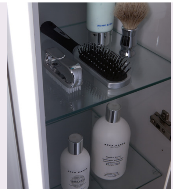
Ergänzungsschränke mit Glasböden und LED-Leuchttollen