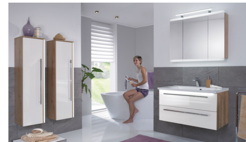
Einzelkombination 906 mm breit, Front- / Korpusdekor: Polarweiß hgl. / Eiche natur Nachbildung