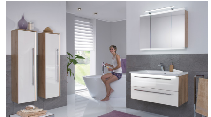
Einzelkombination 906 mm breit, Front- / Korpusdekor: Polarweiß hgl. / Eiche natur Nachbildung