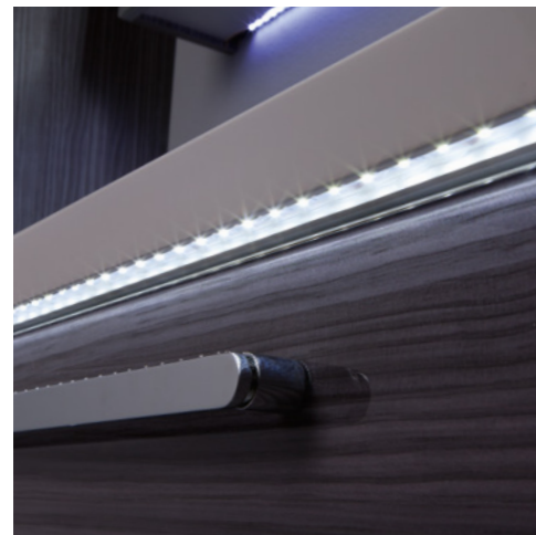
Einzelkombination 906 mm breit, Front- / Korpusdekor: Eiche natur Nachbildung

ENTDECKEN SIE DIE INDIVIDUELLEN MÖGLICHKEITEN der MONDO GLOSS Badmöbelserie. Ansprechendes Design verbunden mit funktionalen Highlights machen hier den besonderen Reiz aus. Die Vielfalt der Schrankvariationen, verbunden mit trendigen Front- und Korpusdekoren, lässt keine Wünsche offen. Passend dazu die Waschtische in Mineralguss und Keramik. Für den besonderen Glanz im MONDO Bad sorgen zusätzlich die optionalen Lichtakzente mit angesagter LED-Technik.