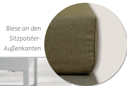
Biese an den Sitzpolster-Außenkanten

Bestellbare Fußausführungen: Metallfuß FY1 weiß oder Metallkufe F 15 weiß (gegen Mehrpreis). Bitte bei Bestellung angeben.