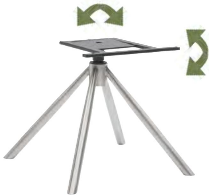
Gestell V37-M mit Drehfunktion + MOTION-Funktion B/H/T ca. 45 / 40 / 45 cm