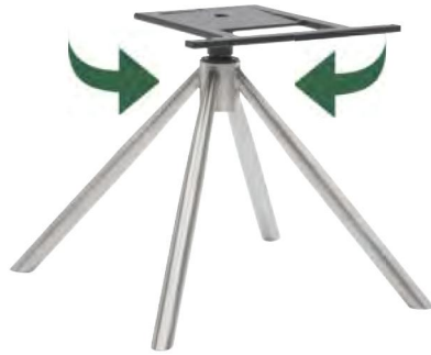
Gestell V37-R mit Dreh- und automatischer Rückstellfunktion B/H/T ca. 45 / 40 / 45 cm