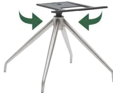
Gestell V38-R mit Dreh- und automatischer Rückstellfunktion B/H/T ca. 45 / 40 / 45 cm