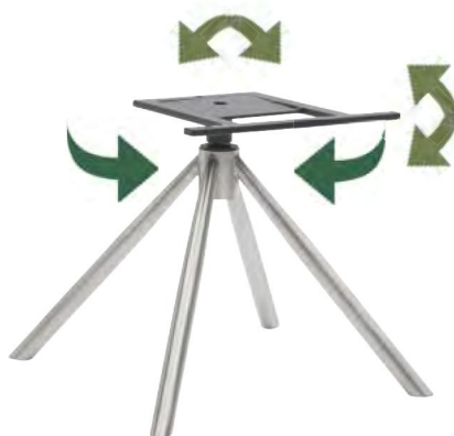
Gestell V37-RM mit Dreh- und automatischer Rückstellfunktion + MOTION-Funktion B/H/T ca. 45 / 40 / 45 cm