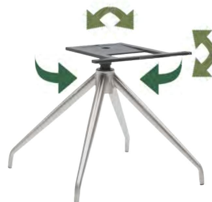
Gestell V38-RM mit Dreh- und automatischer Rückstellfunktion + MOTION-Funktion B/H/T ca. 45 / 40 / 45 cm