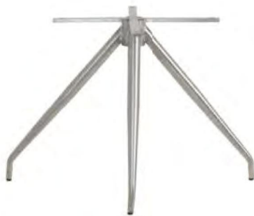
Gestell V1 B/H/T ca. 45 / 40 / 45 cm