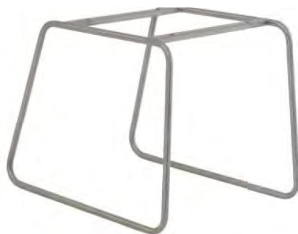
Gestell V2 B/H/T ca. 50 / 40 / 52 cm