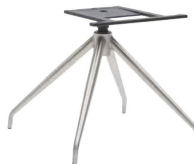
Gestell V38 mit Drehfunktion B/H/T ca. 45 / 40 / 45 cm