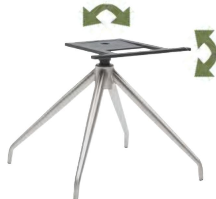
Gestell V38-M mit Drehfunktion + MOTION-Funktion B/H/T ca. 45 / 40 / 45 cm