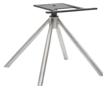
Gestell V37 mit Drehfunktion B/H/T ca. 45 / 40 / 45 cm