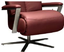
Armteil 4 gegen Aufpreis