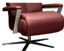
Armteil 4 gegen Aufpreis