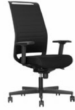
Bürodrehstuhl mit NetZRückenlehne