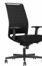
Bürodrehstuhl mit NetZRückenlehne Bürodrehstuhl mit 3D Netzstoff