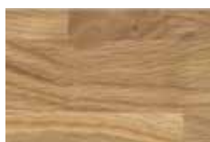
Eiche natur geölt