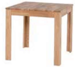
Pedro 80x80 cm