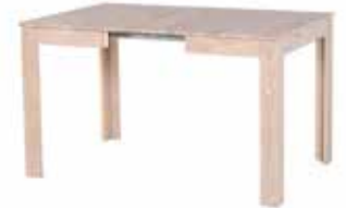
Pedro 1XL 86 ausgezogen