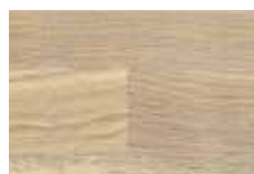
Eiche sonoma lackiert