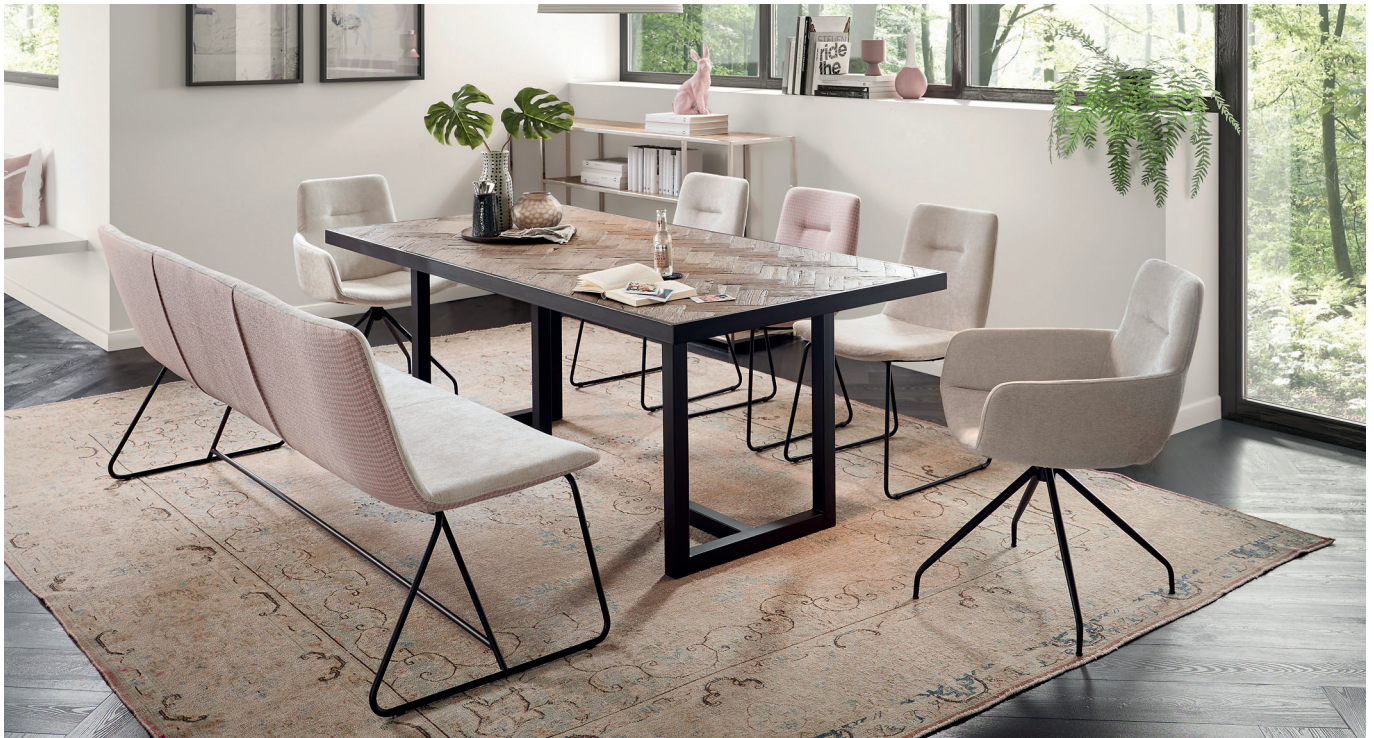
Solobank, Stühle und Armlehnenstühle