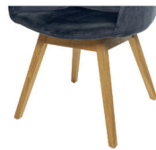
991 Spinnenfuß drehbar schwarz matt