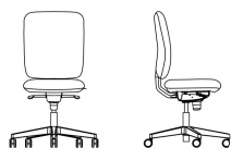
GARTA UPH TS25 FS