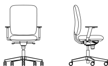
Beispielkonfiguration: GARTA UPH TS25 R25 FS